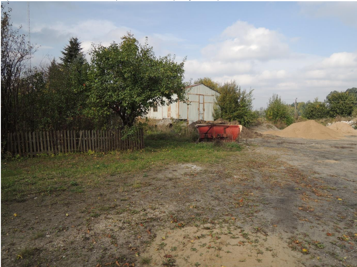
Rysunek 4. Widok na metalowy obiekt do adaptacji lub wyburzenia

W części V przedstawiono przykładową koncepcję zagospodarowania działki (układ funkcjonalny PSZOK).