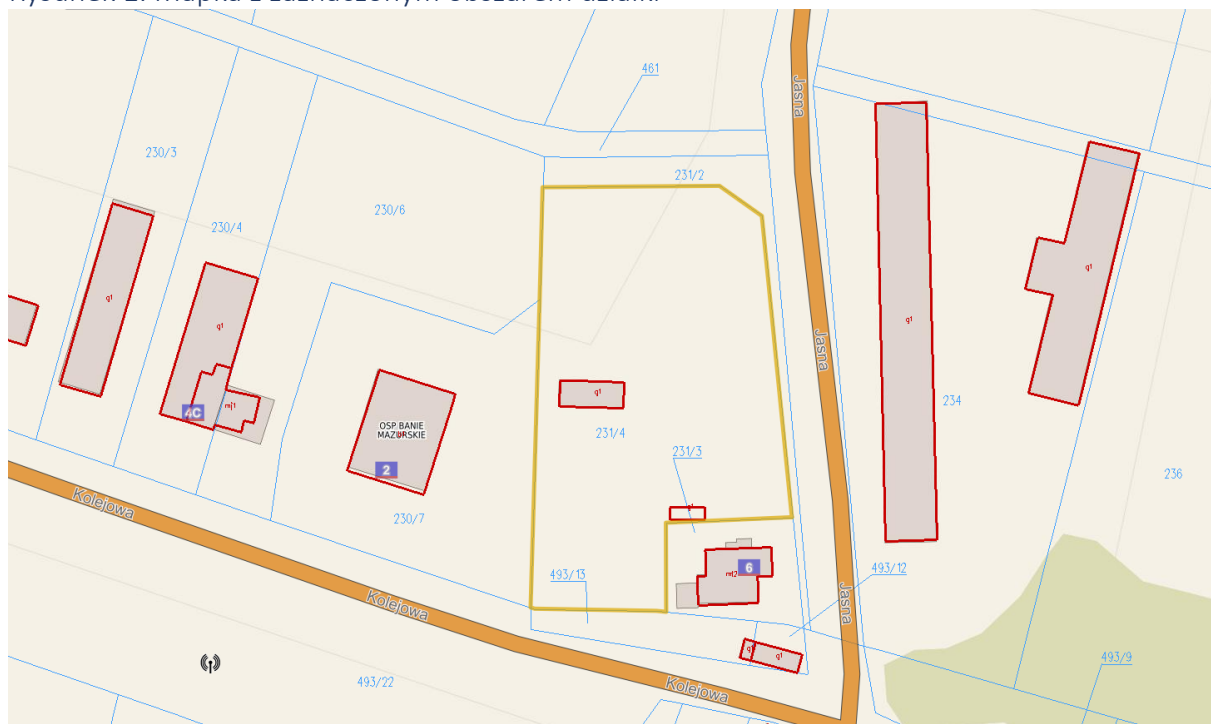
Rysunek 1. Mapka z zaznaczonym obszarem działki

Dojazd do działki zapewniony od ul. Jasna zaraz za skrzyżowaniem z ul Kolejową.